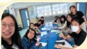
聯合小組活動-寫祝福摺紙鶴