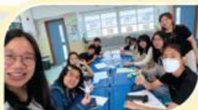
聯合小組活動-寫祝福摺紙鶴