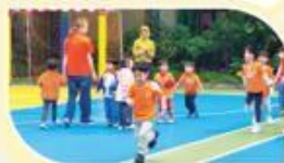
動一動，親子時間更輕鬆