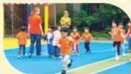
動一動，親子時間更輕鬆