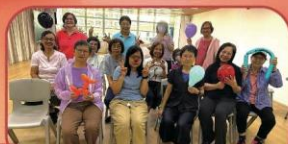
但以理小組 福音小丑分享與扭氣球學習