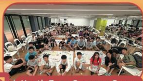
Youth Zone Summer Camp