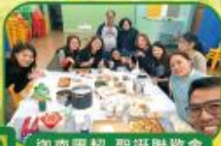
迦南團契-聖誕聯歡會