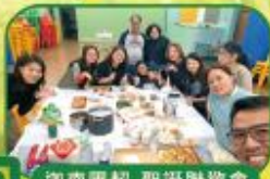
迦南團契-聖誕聯歡會