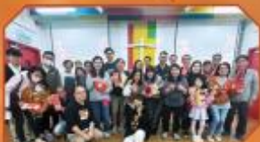
仇善團契-齊齊賀元宵