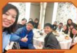
團契自選總會-飲茶