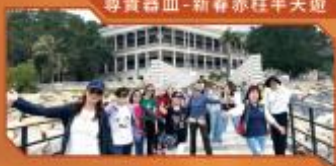
尊貴器皿-新春赤柱半天遊